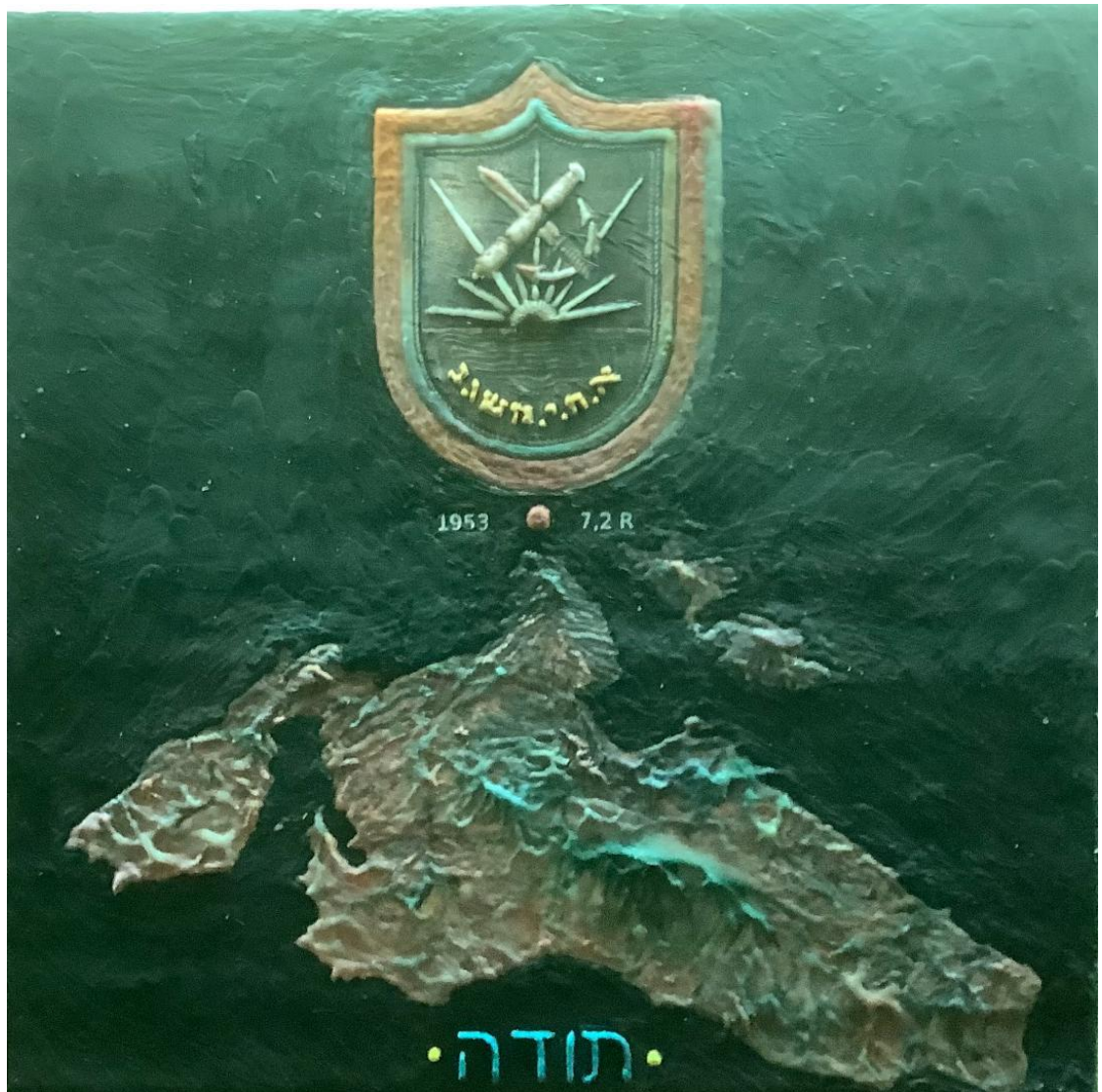
Αλέξης Αυλάμης, Ο στόλος της αγάπης και της ελπίδας , 2022, εγκαυστική σε ξύλο, 30x30 εκ.

Από τον θυρεό αυτό εμπνεύστηκε ο ζωγράφος Αλέξης Αυλάμης και φιλοτέχνησε, με την εγκαυστική μέθοδο, μια σύνθεση, με τον τίτλο Ο στόλος της αγάπης και της ελπίδας , στην οποία άνω