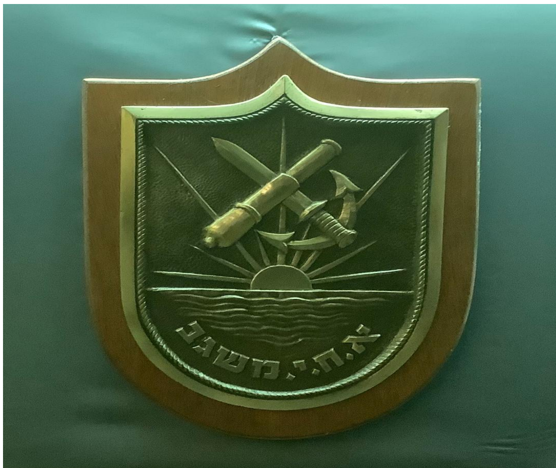
Θυρεός του πλοίου ISN MISGAV, ξύλο και μέταλλο, 26x20 εκ.