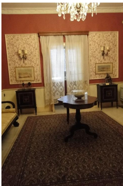
ΕΚΘΕΜΑ ΝΟΕΜΒΡΙΟΥ 2024