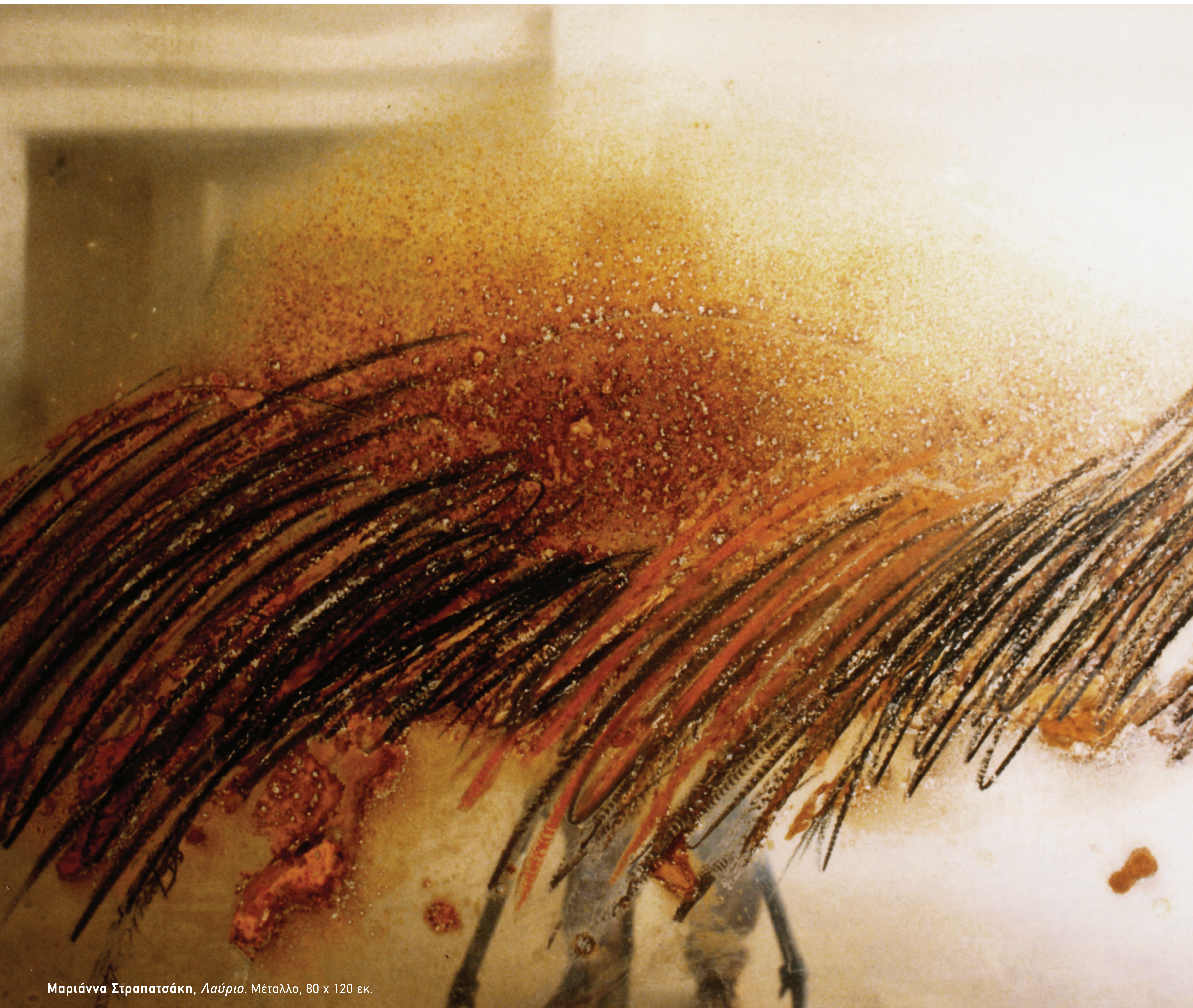
Μαριάννα Στραπατσάκη, Λαύριο . Μέταλλο, 80 x 120 εκ.