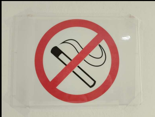
Απαγορεύεται το κάπνισμα