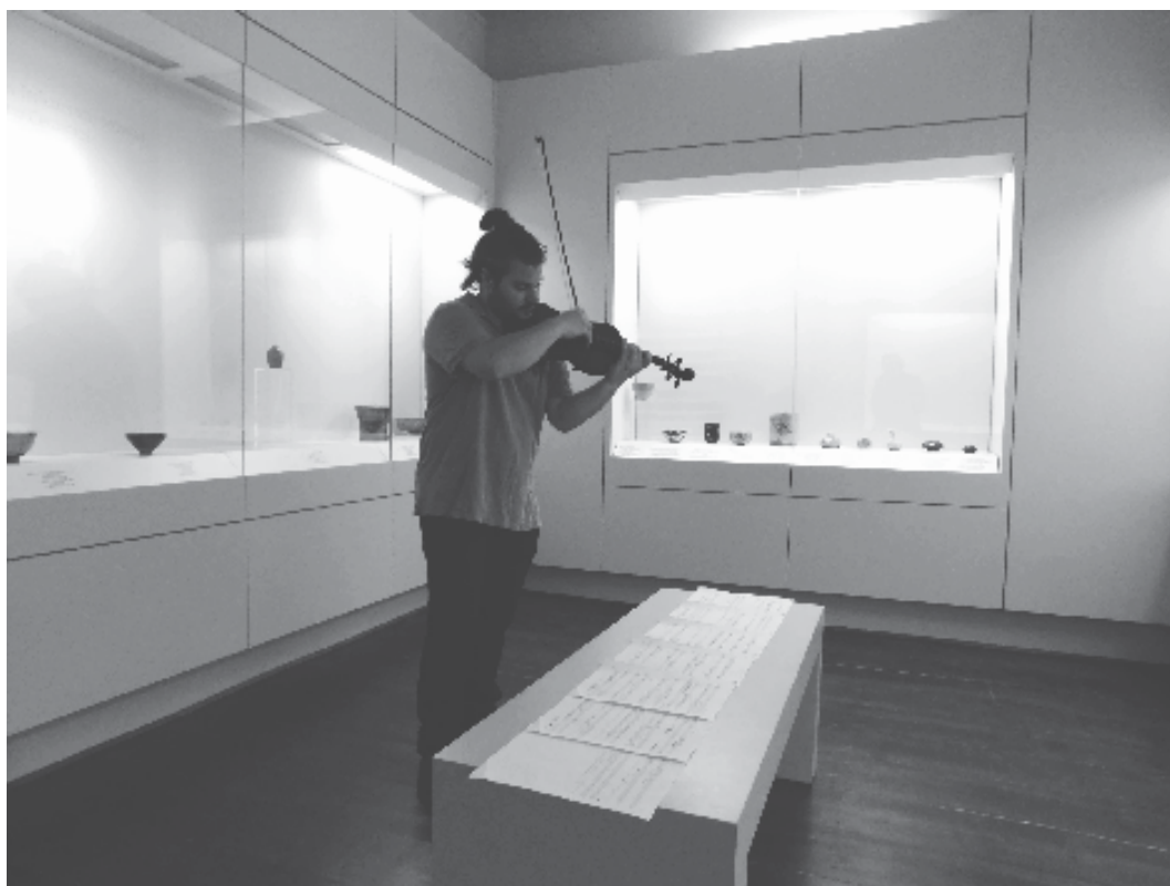
Εικ. 4. Στιγμιότυπο της δράσης «Επτ7α».

το ερωτηματολόγιο για την στατιστική έρευνα.