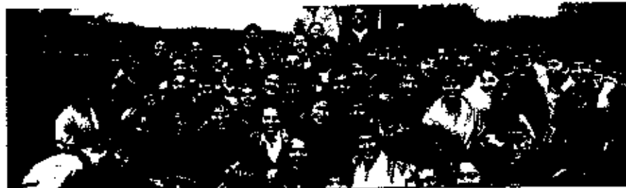
Influencing Practice & Promoting Value Based Growth