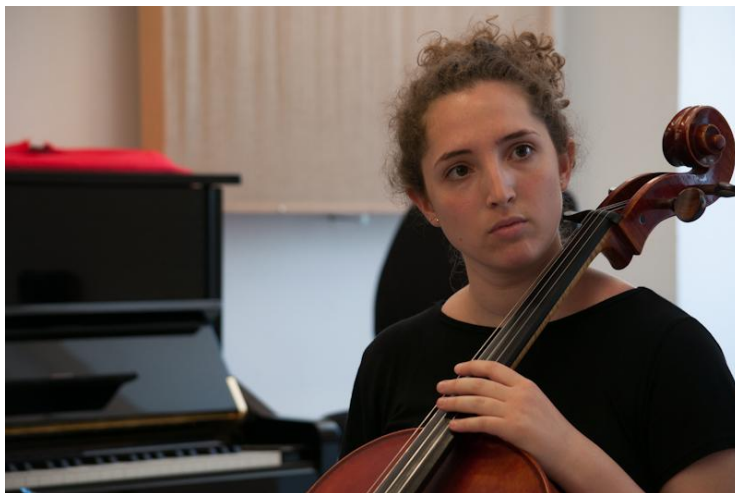
Φοιτήτρια από το κονσερβατόριο Castilla la Mancha της Ισπανίας

Τα Σεμινάρια, οι διαλέξεις, οι συναυλίες και οι ανάλογες εκδηλώσεις, έδωσαν την ευκαιρία στους σπουδαστές του οργάνου να τονώσουν το ενδιαφέρον τους, να μετρήσουν τις επιδόσεις τους και να διευρύνουν τους μουσικούς τους ορίζοντες, συζητώντας και ανταλλάσσοντας ποικίλες απόψεις όσον αφορά τη διδασκαλία και εκτέλεση του βιολοντσέλου.