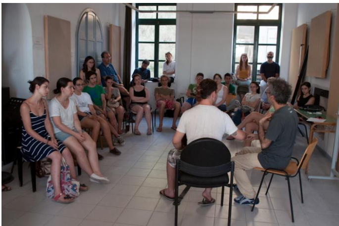
Σεμινάριο με τον καθ. Pietro Serafin από το κονσερβατόριο της Τεργέστης

Κατά την 1 η Μεσογειακή Συνάντηση Βιολοντσέλου, οι καθηγητές κατάφεραν να δημιουργήσουν ένα δίκτυο μουσικής συνεργασίας στη Μεσόγειο, το οποίο ανά δύο – τρία χρόνια θα ταξιδεύει σε άλλη χώρα και πόλη, διατηρώντας την επικοινωνία και τη συνεργασία μεταξύ των χωρών της Μεσογείου.