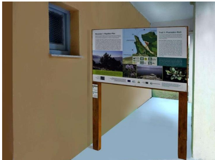
Ενδεικτική φωτογραφία περιεχομένου Πανακίδας Υποδοχής

Ο Ανάδοχος καλείται να υλοποιήσει τον γραφικό σχεδιασμό και την επιμέλεια του υλικού που θα του διαθέσει η Αναθέτουσα Αρχή σε συνεννόηση με τον Επιστημονικό Υπεύθυνο του Έργου. Η επιμέλεια περιλαμβάνει και την μετάφραση των κειμένων στην αγγλική γλώσσα. Η επιφάνεια πλήρωσης (τοποθέτησης της πληροφορίας) ισούται με 70 εκατοστών του μέτρου πλάτος και 40 εκατοστών του μέτρου ύψος. Λοιπές κατασκευαστικές λεπτομέρειες που μπορεί να προκύψουν θα δοθούν κατά την επίβλεψη του έργου.