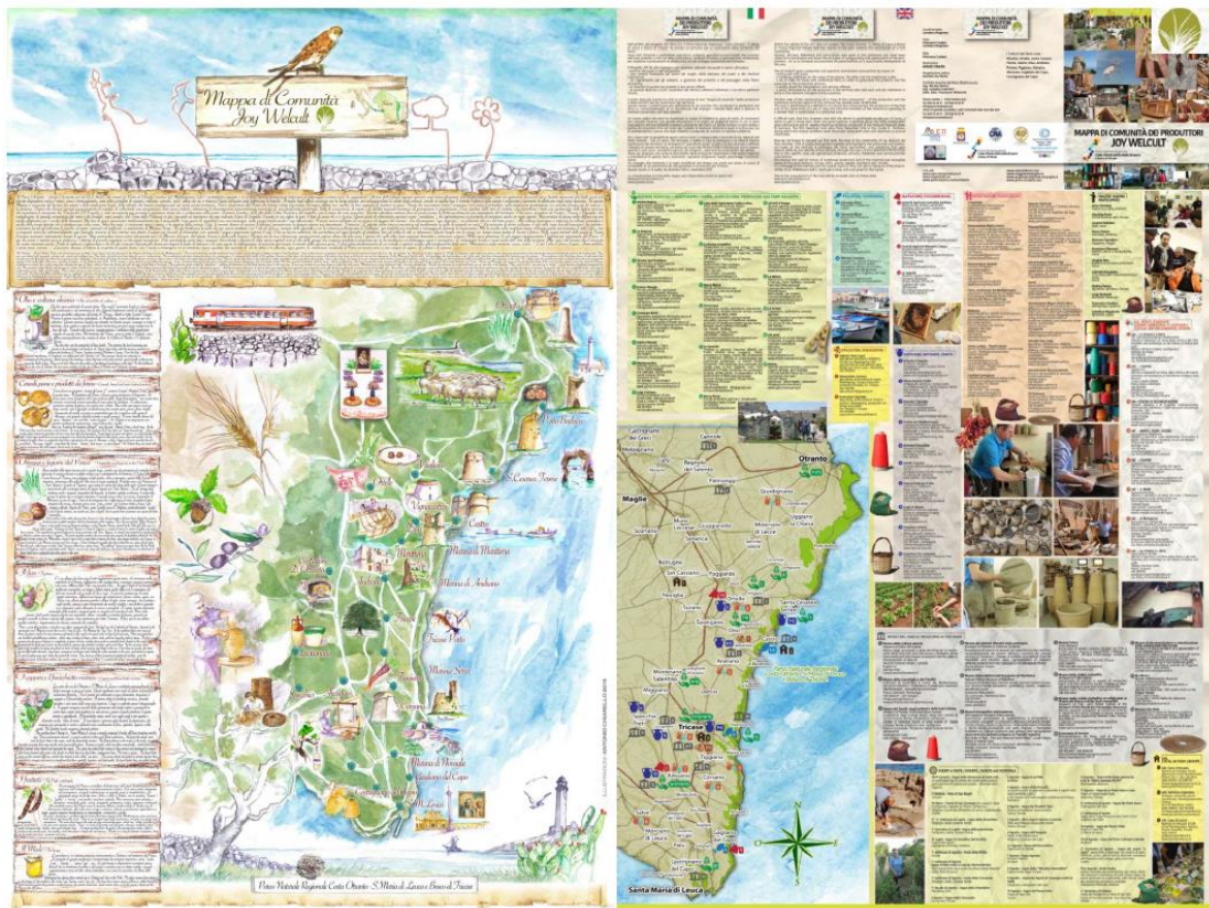
Ενδεικτική φωτογραφία των δύο όψεων χάρτη Οικομουσείου

Τμήμα Γ: Τεχνική υποστήριξη για τη γεωχωρική αποτύπωση των θέσεων πολιτιστικού ενδιαφέροντος της νήσου Κέρκυρας, που προέκυψαν από την έρευνα και ανάλυση (στο πλαίσιο άλλου παραδοτέου) και τη σύνδεση τους με την υφιστάμενη Γεωχωρική Βάση Δεδομένων της Νήσου Κέρκυρας (WP3– D3.4.2 Technical support for the implementing of the analysis and research results in the Territorial Information System of Corfu ).