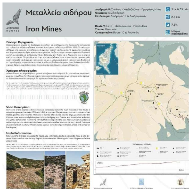
Ενδεικτική φωτογραφία περιεχομένου Πινακίδας Υποδοχής

Ο Ανάδοχος καλείται να υλοποιήσει τον γραφικό σχεδιασμό και την επιμέλεια του υλικού που θα του διαθέσει η Αναθέτουσα Αρχή σε συνεννόηση με τον Επιστημονικό Υπεύθυνο του Έργου καθώς και την μετάφραση των κειμένων στην αγγλική γλώσσα καθώς και την δημιουργία χαρτών με την αποτύπωση της πορείας των διαδρομών, με βάση υλικό που θα του διαθέσει ο ανάδοχος. Η επιφάνεια πλήρωσης (τοποθέτησης της πληροφορίας) ισούται με 1 μέτρο πλάτος και 70 εκατοστών του μέτρου ύψος και οι διαστάσεις του εκτυπώσιμου υλικού θα είναι 90X60 εκ. Λοιπές κατασκευαστικές λεπτομέρειες που μπορεί να προκύψουν θα δοθούν κατά την επίβλεψη του έργου.