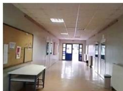
Εγκαταστάσεις του Τμήματος Επιστήμης και Τεχνολογίας Τροφίμων, Αργοστόλι