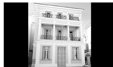
Τμήμα Τουρισμού, Κτήριο Καλυψώ