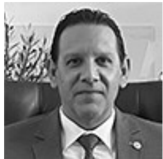
Ο Πρύτανης του Ιονίου Πανεπιστημίου Καθηγητής κ. Ανδρέας Φλώρος