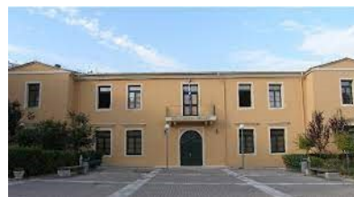
Βιβλιοθήκη και Κέντρο Πληροφόρησης Ιονίου Πανεπιστημίου, Κεντρικό Κτήριο, Κέρκυρα

Τα Τμήματα Εθνομουσικολογίας, στο Ληξούρι, και Περιφερειακής Ανάπτυξης, στη Λευκάδα, τελούν σε αναστολή και δεν δέχονται προς το παρόν φοιτητές.