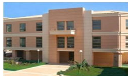
Τμήμα Ιστορίας και Τμήμα Αρχειονομίας, Βιβλιοθηκονομίας και Μουσικολογίας