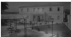
Τμήμα Πληροφορικής, Κτήριο Αρεταίος

Τ ο Τμήμα Πληροφορικής καλλιεργεί και να προάγει την Πληροφορική Επιστήμη, με ιδιαίτερη έμφαση στη θεωρία και τις εφαρμογές της Πληροφορικής στους τομείς των Ανθρωπιστικών και Κοινωνικών