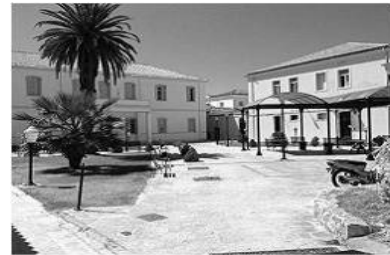
Τμήμα Ξένων Γλωσσών Μετάφρασης και Διερμηνείας, Κτήριο Γαληνός