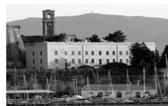
Τμήμα Μουσικών Σπουδών